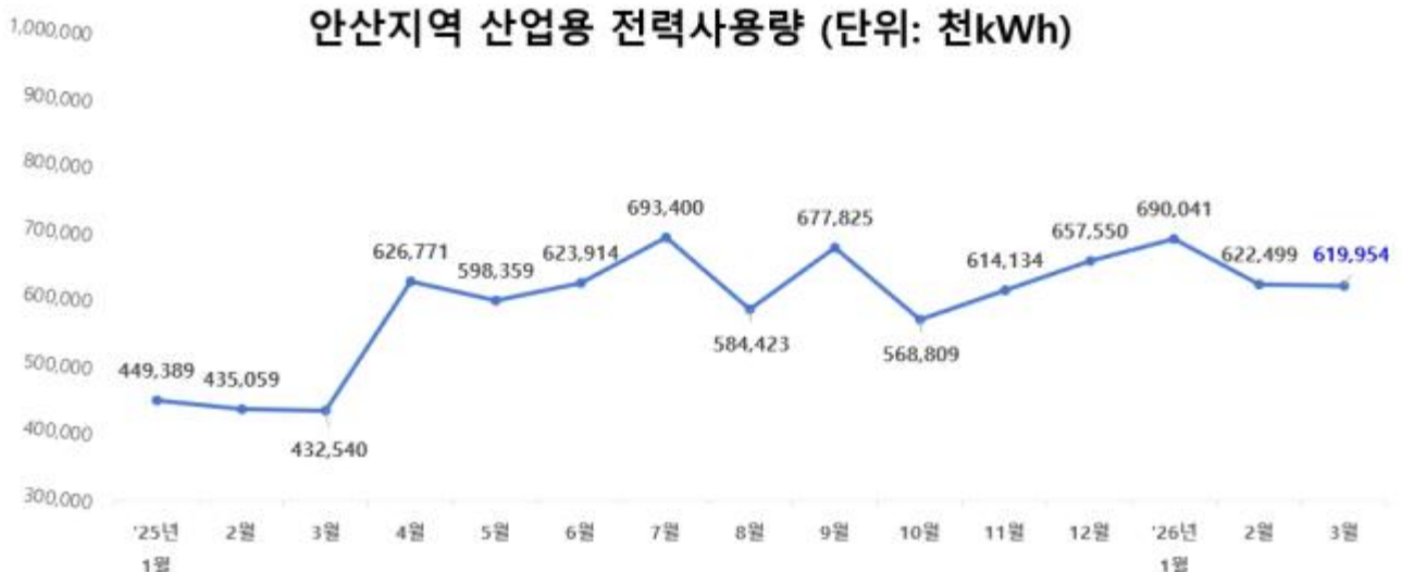
안산지역 산업용 전력사용량 (단위: 천kWh)